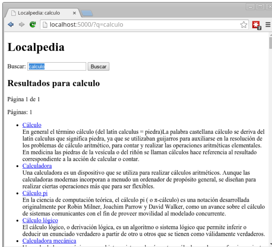
Figura 3: Demostración